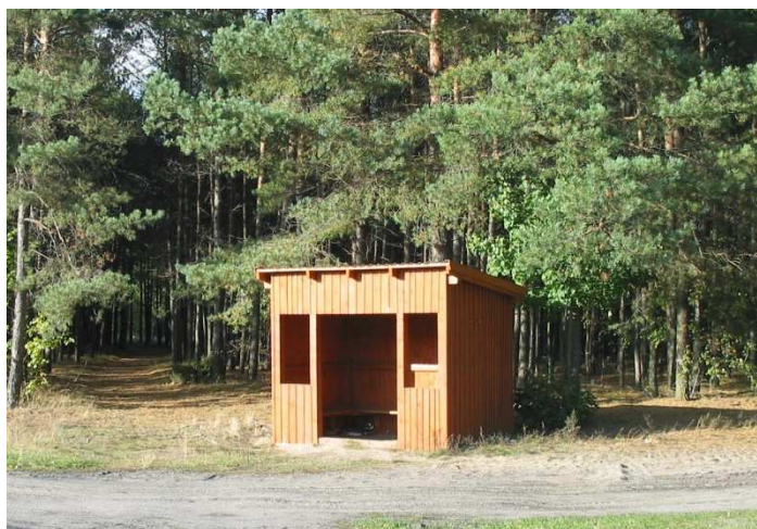
Przystanek dla autobusu szkolnego w Mosnej

Na terenie wsi znajduje się przystanek dla autobusu szkolnego w postaci drewnianej wiaty. Można to uznać za znaczne udogodnienie dla dzieci i młodzieży, które stanowi ochronę przed niekorzystnymi warunkami pogodowymi.