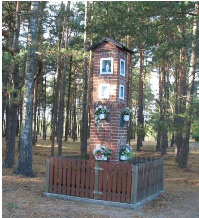
Kapliczka św. Rocha i św. Rozalii

We wsi Mosna zachował się ciekawy układ zabudowy, który przybrał formę niemal idealnego okręgu.