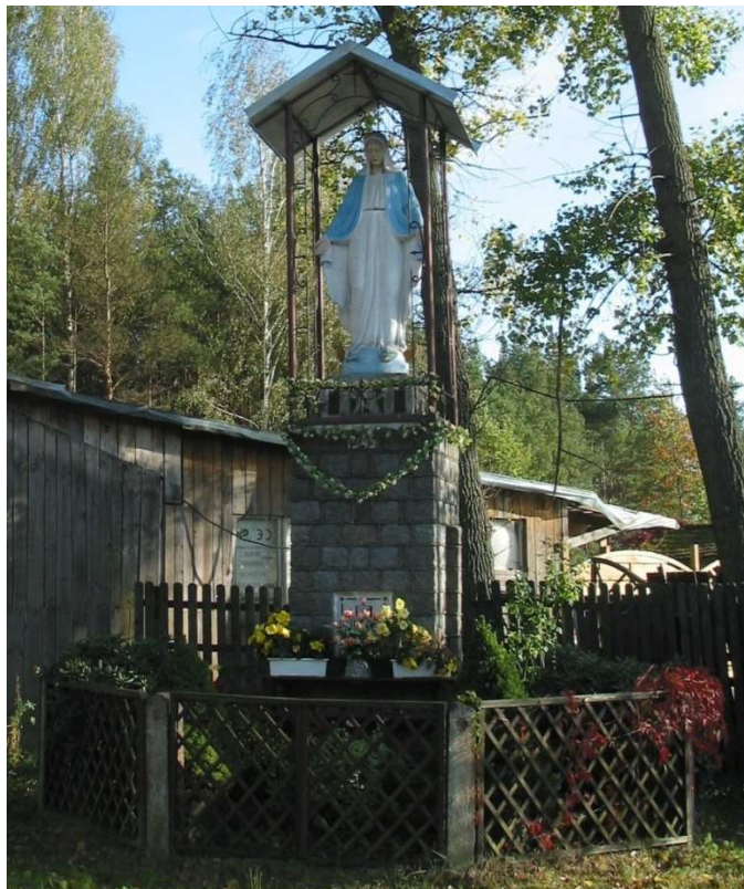
Figura Matki Bożej w Mosnej