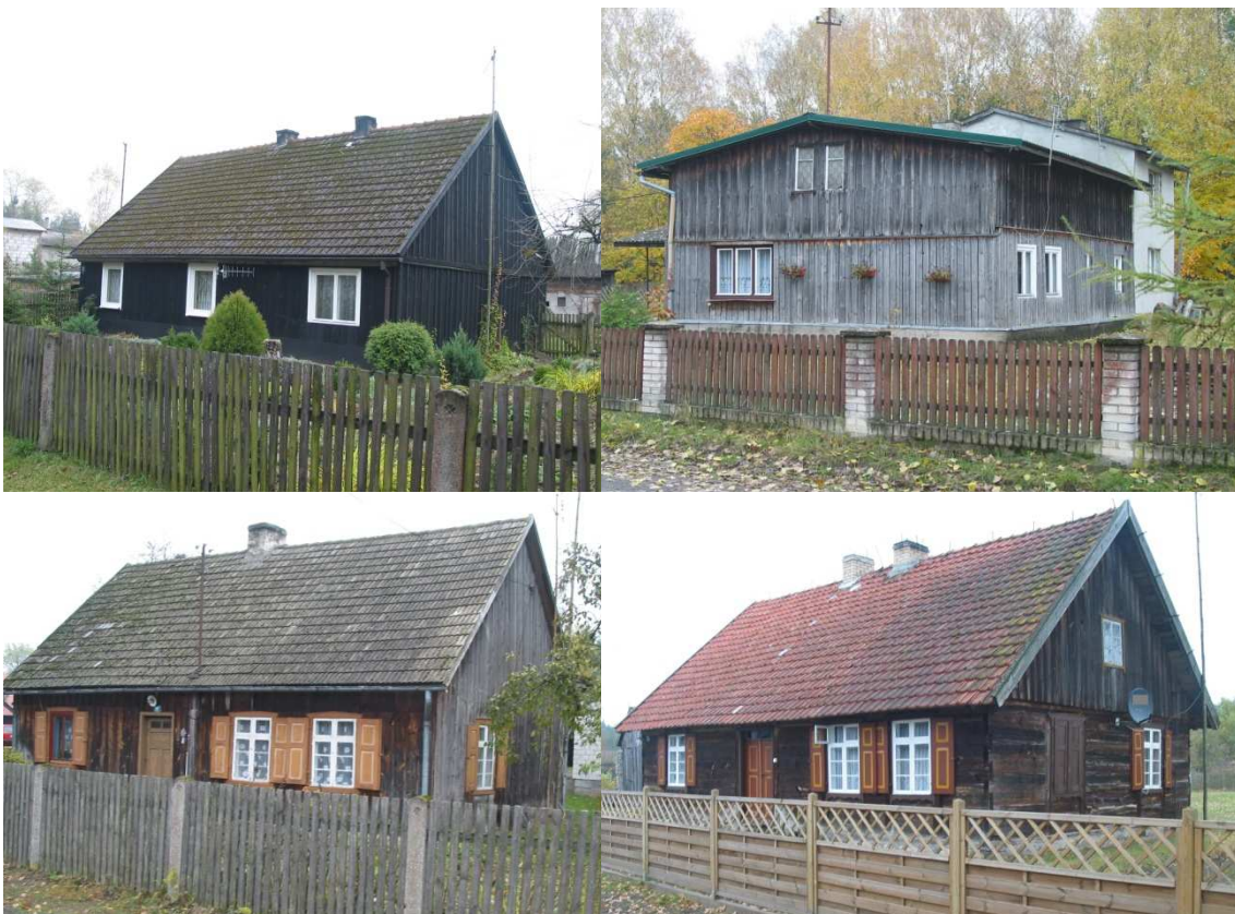
Zabytkowe domy wsi Mosna

We wsi Mosna zachował się ciekawy układ zabudowy, który przybrał formę niemal idealnego okręgu.